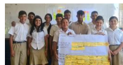
Jóvenes de CE El Jagüey reflexionan sobre los cambios realizados