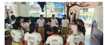
Jóvenes de CE Mario Gómez reflexionan sobre el Árbol de la Felicidad